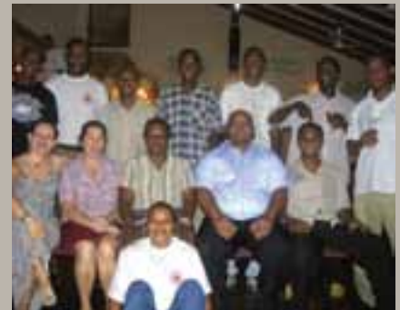
Responsables del reclutamiento de donantes de sangre