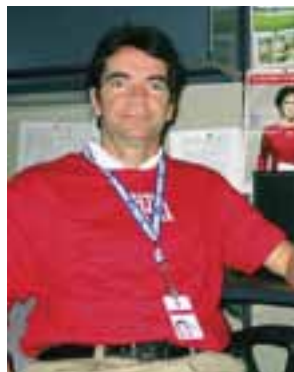
Miembros del personal de toda la organización se involucran en esta campaña

¿Por qué llevar mangas cortas? Para poder así estar siempre listos para donar sangre y ayudar a salvar una o más vidas. Con este tema tan veraniego, Héma-Québec deseaba alentar a los habitantes de Quebec a donar sangre -aun durante el verano, aun cuando estuvieran de vacaciones- durante la campaña de verano que se extiende desde el 12 de junio hasta el 10 de septiembre. Héma-Québec espera que esta prenda de vestir se convierta en un símbolo distintivo de la causa de la donación de sangre en Quebec. ■