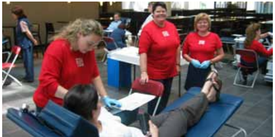
Una unidad móvil de donación de sangre en las afueras de Montreal el 14 de junio de 2006

En Quebec, Canadá, se llevó a cabo la tercera celebración anual del Día Mundial del Donante de Sangre de una manera original y pintoresca. Para destacar este evento internacional y el lanzamiento de su campaña de verano, Héma-Québec invitó a los miembros del personal y a los voluntarios de los lugares de la campaña de sangre, centros de donantes de sangre y sus dos establecimientos en Montreal y Quebec a usar mangas cortas. El 14 de junio, los donantes también llevaron orgullosamente una camiseta roja de un diseño inusual, con mangas de dos largos diferentes: una larga y la otra corta. El brazo izquierdo, el lado del corazón, se dejó sin cubrir para simbolizar el generoso gesto de la donación de sangre. Fue una manera original de representar e identificar a los donantes y al mismo tiempo de rendirles homenaje.