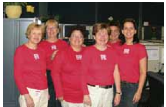
El equipo de telerreclutamiento del establecimiento de la ciudad lleva con orgullo mangas cortas