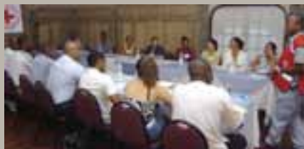
Unos 20 Responsables del reclutamiento de donantes de distintas organizaciones, como la Policía, la Empresa de Transporte Público y Air Seychelles asistieron al primer taller de formación organizado por la CR de Seychelles, que tuvo lugar el 27 de septiembre. En la fotografía aparecen los participantes del taller el día previo al lanzamiento de la campaña nacional: "Inicia una tendencia; trae a un amigo - Dona sangre."