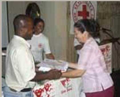
Entrega de certificados a los responsables del reclutamiento de donantes de sangre que completaron el módulo "sangre y seguridad de la sangre"