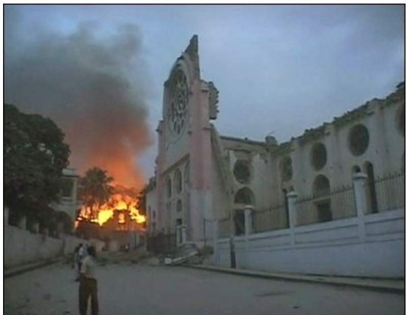
En esta toma de vídeo del 12 de enero de 2010, un incendio estalla cerca de un edificio dañado después del gran terremoto en Puerto Príncipe. El terremoto de magnitud 7.0 golpeó la empobrecida Haití el martes, derribó edificios en la ciudad capital de Puerto Príncipe, enterró residentes en escombros y ocasionó muchos muertos y heridos.

El terremoto ha agravado aún más las condiciones humanitarias ya son muy difíciles en el país. Las zonas más afectadas por el terremoto, la ciudad capital de Puerto Príncipe está densamente poblada con más de dos millones de habitantes, muchos de los cuales viven en barrios marginales o chabolas. Los edificios del Gobierno se han derrumbado o están gravemente dañados, incluyendo el palacio presidencial y varios ministerios. La mala calidad de construcción de los edificios contribuyó a la situación en general. La sede de la Sociedad Nacional de la Cruz Roja Haitiana que alberga las oficinas de la Federación Internacional también ha sido dañada en la capital, con muchos funcionarios desaparecidos. Más de 100 funcionarios de las Naciones Unidas están desaparecidos. Aunque está emergiendo la extensión de la destrucción masiva en Puerto Príncipe, es importante tener en